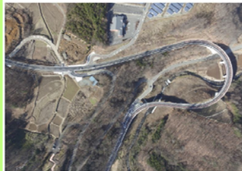
平成28年度優良工事表彰