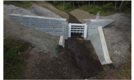
古杣西沢砂防工事(明許) 山梨県中北建設事務所