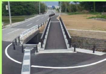
平成26年度優良工事表彰