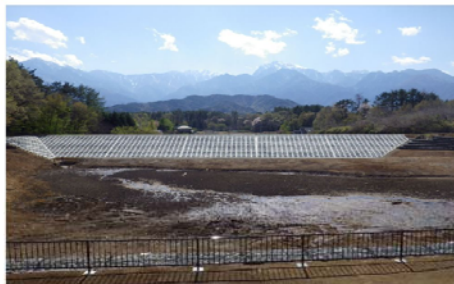
長坂地区 昭和堤ため池改修工事 山梨県中北農務事務所