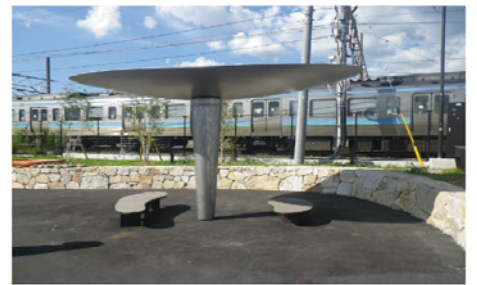
小淵沢駅前広場附帯施設設置工事 山梨県 北杜市