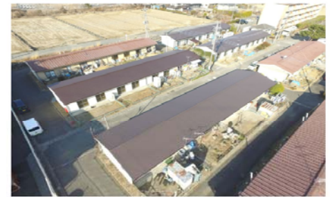
市営武川団地（D・E・H棟）改修工事 山梨県 北杜市