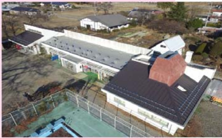
北杜市立しらかば保育園さくら分園 屋上防水改修工事