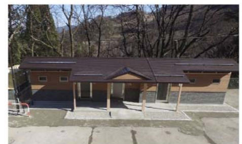
尾白川溪谷駐車場公衆トイレ設置工事 山梨県 北杜市