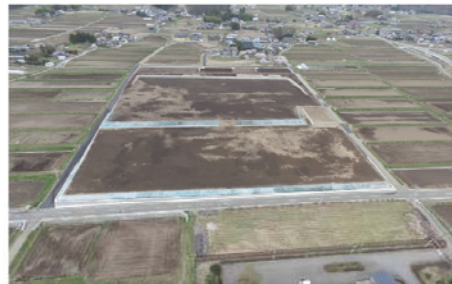
寺所地区 区画整理及び用排水路工事 山梨県中北農務事務所