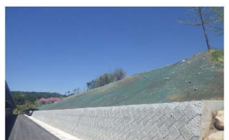
外構・馬洗場移設工事 (公財) 山梨県馬事振興センター