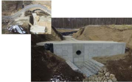
(主) 北杜富士見線道路防災工事 山梨県中北建設事務所