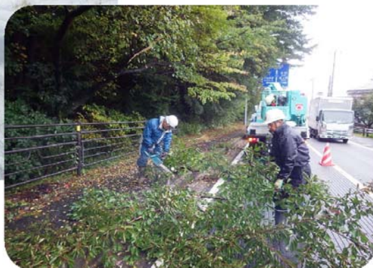
道路維持管理作業