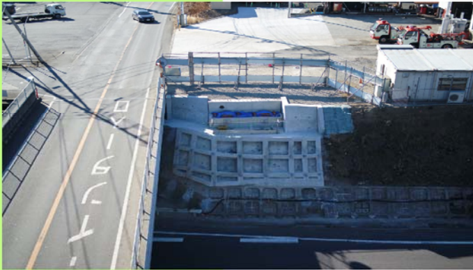
令和2年度 優良工事表彰