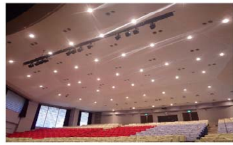
甲陵高等学校講堂改修工事 山梨県 北杜市