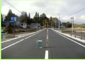
平成24年度優良工事表彰