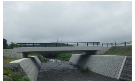
長坂地区 長坂活性化農道(鳩川橋梁・長坂第5工区)道路工事(明許) 山梨県中北農務事務所