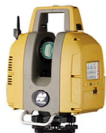
地上レーザースキャナー