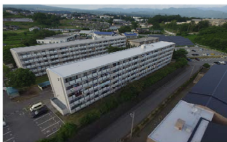
市営サンコーポラス長坂団地（2号棟）改修工事【明許】