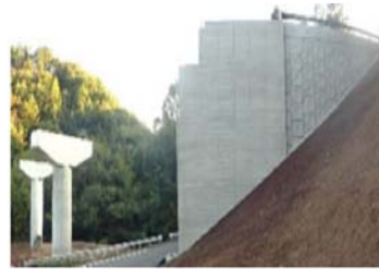
平成25年度優良工事表彰