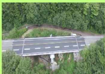
令和元年度 優良工事表彰