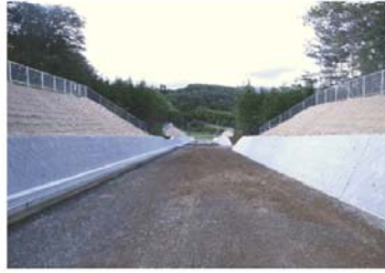
平成24年度優良工事表彰