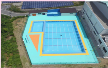
明野小学校改修（建築）工事 （第Ⅰ期）（明許）

ビジネスや生活の拠点となりうる建築物を建設し地域の経済の支えの手助けをしていきます。また不要になった橋や建築物などの解体工事にも携わっています。