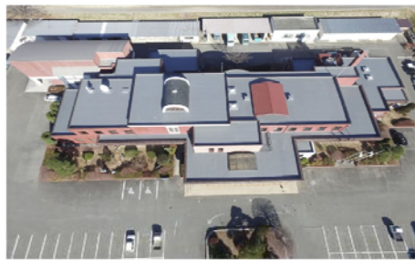
高根総合支所庁舎屋根・外壁防水改修工事 山梨県 北杜市