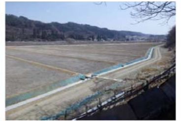
平成25年度優良工事表彰