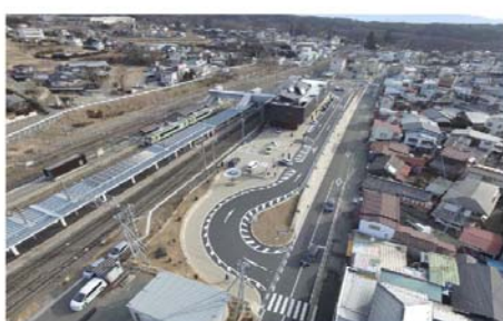
小淵沢駅前広場整備工事 2 工区 山梨県北杜市