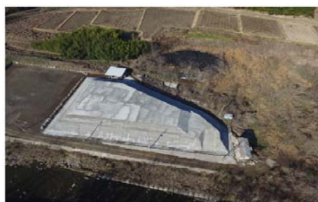
北杜市須玉町地内産業廃棄物不適正処理事案対策工事(明許) 東向地区 山梨県 森林環境部