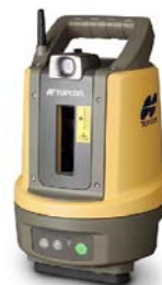
レイアウトナビゲーター