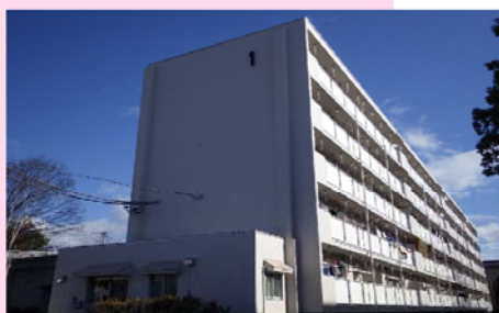
市営サンコーポラス長坂団地（1号棟）改修工事【明許】