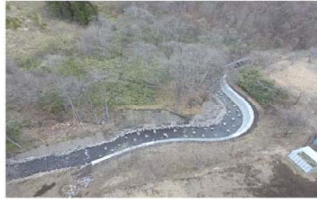
大深沢川河川災害復旧工事(H30災第33号) (その1)(明許) 山梨県中北建設事務所