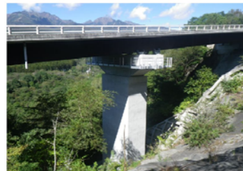
平成29年度優良工事表彰